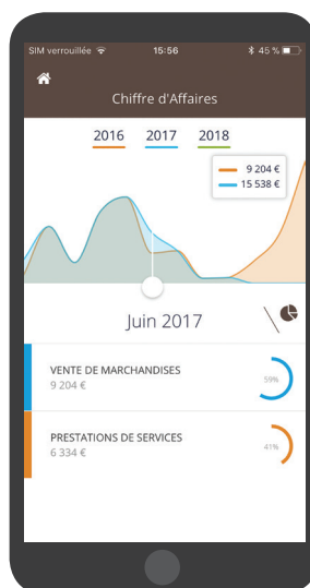
Aperçu en version mobile