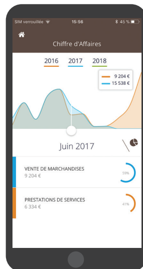
Aperçu en version mobile